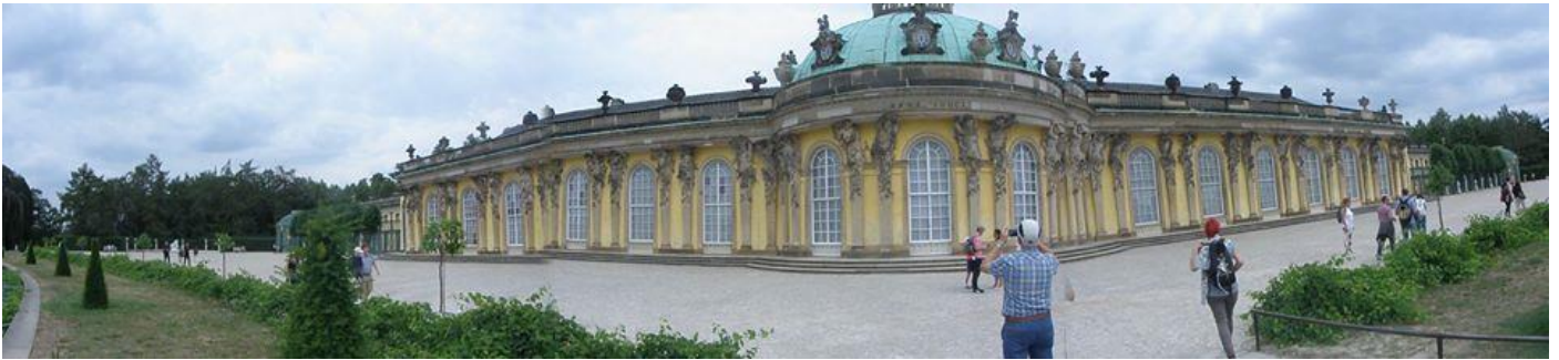
Potsdam (Nagy Frigyes kastélya)

Szabadidőnket szervezeten és egyénileg is eltölthettük. Meglátogattuk a szombati napon Potsdamot és a többi délután is tettünk közös kirándulásokat a közelben található nevezetességekhez illetve kiállításokra. Az oktatási helyszín Berlin belvárosában található így tömegközlekedéssel nagyon rövid idő alatt szinte minden fontosabb épület elérhető volt.